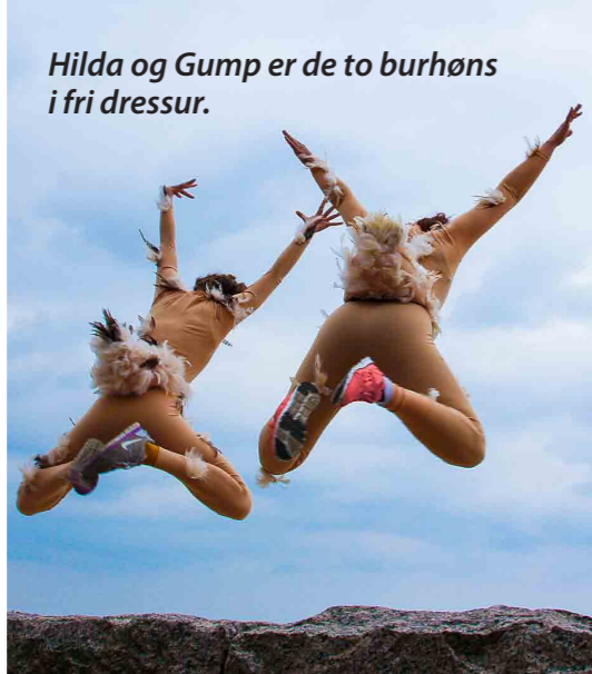
Hilda og Gump er de to burhøns i fri dressur.

Følg Hilda og Gump i denne ordløse forestilling, hvor det maleriske kropssprog, finurlige gags og den gavmilde mimik fortæller historien.